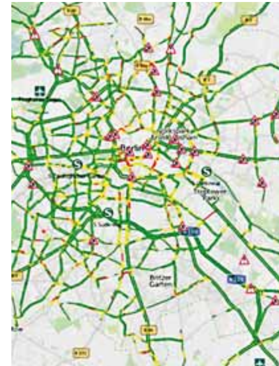
Beim Paketdienstleister DHL werden Routen ausgewählter Lieferfahrzeuge mithilfe der „dynamischen Verkehrslenkung“ optimiert

„Über Wochen und Monate entsteht so ein Datensatz, der den Geschwindigkeitsverlauf auf großen Straßen über einen typischen Tag abbildet“, sagt der DLR-Forscher. Anhand dieser Hinweise würde die Software in Berlin beispielsweise die Leipziger Straße morgens halb zehn sicher umgehen wollen. „Über die Echtzeitmessungen der Taxis erfahren wir zudem sehr schnell, wo gerade ein Stau ist.“ Anhand dieser Informationen optimiert die Software im Lauf des Tages die Routen immer wieder neu.