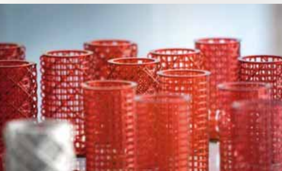
Modelle des Glasschwamms Eplectella sp. (Max-Planck-Institut für Kolloid- und Grenzflächenforschung, Potsdam-Golm Wissenschaftspark)

Dabei wird auch der Modellbau reflektiert werden. Der Code, der den Übergang von der zweidimensionalen zur dreidimensionalen Welt beschreibt, fasziniert den Adlershofer Mathematikprofessor Jochen Brüning. Er nennt Graphen als Beispiel, diese eigenartige Modifikation des Kohlenstoffs, das nach der Theorie in der zweidimensionalen Form gar nicht stabil sein dürfte. Ob eine dreidimensionale Struktur mit zweifellos überraschenden Eigenschaften zu erreichen ist? Für Brüning ist das keine Frage. „Der Cluster vereinigt Wissenschaftler, die den Mut haben zu träumen“, sagt der Mathematiker. pj