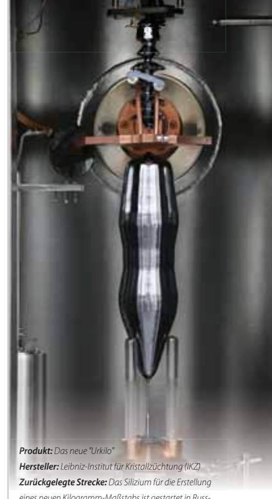
Produkt: Das neue "Urkilo" Hersteller: Leibniz-Institut für Kristallzüchtung (IKZ) Zurückgelegte Strecke: Das Silizium für die Erstellung eines neuen Kilogramm-Maßstabs ist gestartet in Russland, in Berlin wurde der Kristall gezüchtet, in Australien die Kugeln geschliffen, die dann an der Physikalisch-Technischen Bundesanstalt (PTB) in Braunschweig „vermessen“ wurden. Auf der Strecke Nischni Nowgorod-Berlin-Sydney-Braunschweig hat das Material rund 34.500 Kilometer zurückgelegt. Vergleich: Hin- und Rückflug von Berlin nach Wellington, Neuseeland Funktion: Das internationale Forscherteam möchte mit dem Einkristall dabei helfen, das Kilogramm neu zu definieren. Anwendung: Auf diese Weise können die Atome buchstäblich gezählt werden, um neben der Neubestimmung des Kilogramm-Maßstabs auch die Avogadro-Konstante genauer zu bestimmen. Diese gibt an, wie viele Teilchen sich in einem Mol eines Stoffes befinden. Besonderheiten/Innovation: Die Forscher wollen aus dem Volumen der Kugel, der Größe der Elementarzelle und der Zahl der Atome in der Elementarzelle die Zahl der Atome in der Kugel insgesamt bestimmen – am Ende könnte ein neuer Standard für die Maßeinheit Kilogramm stehen, das vom Urkilo in Paris abweicht.