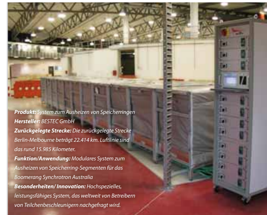
Produkt: System zum Ausheizen von Speicherringen Hersteller: BESTEC GmbH Zurückgelegte Strecke: Die zurückgelegte Strecke Berlin-Melbourne beträgt 22.414 km. Luftlinie sind das rund 15.985 Kilometer. Funktion/Anwendung: Modulares System zum Ausheizen von Speicherring-Segmenten für das Boomerang Synchrotron Australia Besonderheiten/Innovation: Hochspezielles, leistungsfähiges System, das weltweit von Betreibern von Teilchenbeschleunigern nachgefragt wird.