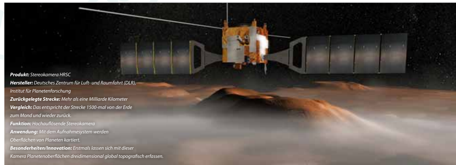
Produkt: Stereokamera HRSC Hersteller: Deutsches Zentrum für Luft- und Raumfahrt (DLR), Institut für Planetenforschung Zurückgelegte Strecke: Mehr als eine Milliarde Kilometer Vergleich: Das entspricht der Strecke 1500-mal von der Erde zum Mond und wieder zurück. Funktion: Hochauflösende Stereokamera Anwendung: Mit dem Aufnahmesystem werden Oberflächen von Planeten kartiert. Besonderheiten/Innovation: Erstmals lassen sich mit dieser Kamera Planetenoberflächen dreidimensional global topografisch erfassen.

Inzwischen hat die Sonde und damit der CDA mehr als fünf Milliarden Kilometer zurückgelegt. Zum Vergleich: Das am weitesten von der Sonne und damit auch von der Erde entfernte menschengemachte Objekt, die vor 35 Jahren gestartete Sonde Voyager 1, hat inzwischen 24 Milliarden Kilometer zurückgelegt. Das sind Distanzen, die das menschliche Vorstellungsvermögen übersteigen. Doch auch andere Innovationen von Instituten und Unternehmen am Standort legen sehr weite Strecken zu ihrem Bestimmungsort zurück. cl