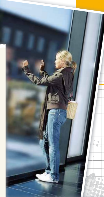
HU-Studentin im Physik-Institut

Besonders zu erwähnen ist dabei IRIS. Das Integrative Research Institute for the Sciences verzahnt universitäre mit außeruniversitären Einrichtungen und innovativen Unternehmen und spiegelt somit die Adlershofer Stärke der grenzübergreifenden Kooperation wider. Die IRIS-Partner